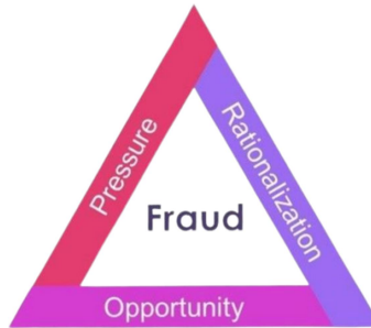
องค์ประกอบของการทุจริต หรือสามเหลี่ยมทุจริต (The Fraud Triangle)

องค์ประกอบหรือปัจจัยที่นำไปสู่การทุจริต ประกอบด้วย Pressure/Incentive หรือแรงกดดันหรือแรงจูงใจ Opportunity หรือโอกาส ซึ่งเกิดจากช่องโหว่ของระบบต่างๆ คุณภาพการควบคุม กำกับควบคุมภายในขององค์กรมีจุดอ่อน และ Rationalization หรือ การหาเหตุผลสนับสนุนการกระทำตามทฤษฎี สามเหลี่ยมการทุจริต (Fraud Triangle)